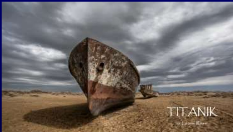
Titanik [ ... ]